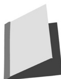
Klientmappe med Dagens session Overblik Baggrund